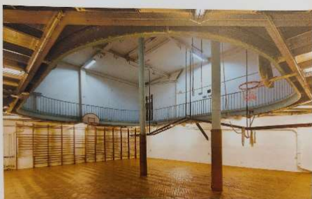
Le centre UCJG de la rue de Trévise, à Paris, a été conçu par l'architecte Emile Bénard

En 1893 est né ce lieu d'accueil, d'entraide et de partage, œcuménique, et où chacun pourrait s'épanouir corps, esprit et foi. On y trouve : un restaurant coopératif, une piscine et un gymnase couverts, une salle polyvalente pour du théâtre, des concerts et des conférences, une bibliothèque, un bowling, un billard et des services sociaux et médicaux... Fin décembre 1893, y est inauguré un nouveau sport en France : le basket, apporté par un éducateur formé à la YMCA de Springfield. Une salle de basket, surplombée d'une piste circulaire de course à pied, est installée dans le gymnase. Elle est aujourd'hui la plus ancienne du monde ! En 2023, un mécénat est lancé pour la rénover : adopter une lame de parquet ( adopteunelame.com ) !