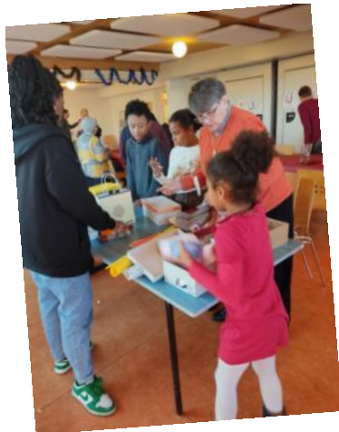
Atelier colis pour les plus démunis.