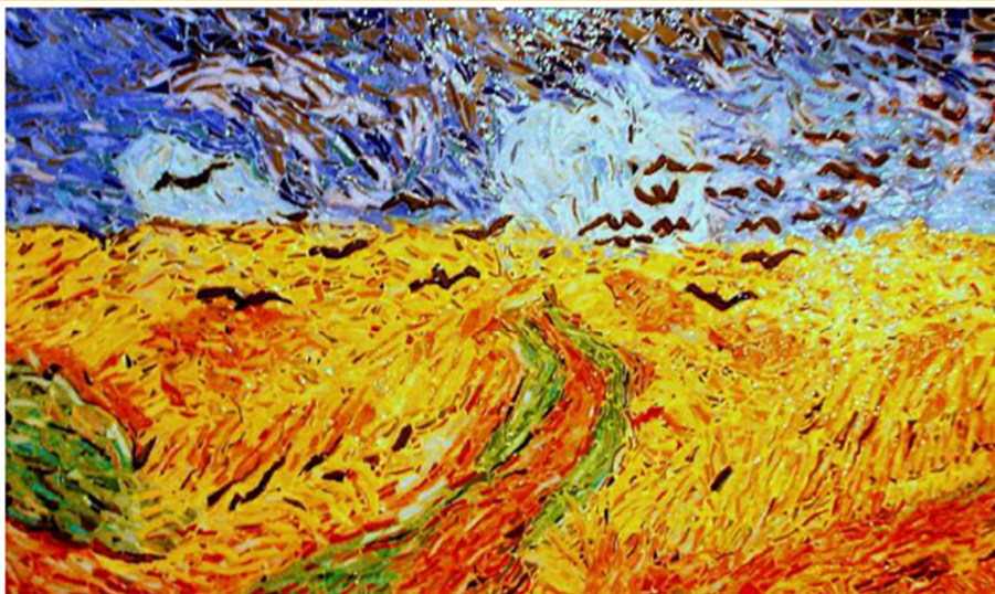
Champs de blé aux corbeaux (1890)

À l'occasion des 170 ans de sa naissance, la ville organise toute une série d'événements.